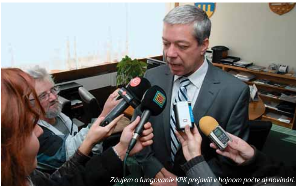
Záujem o fungovanie KPK prejavili v hojnom počte aj novinári.