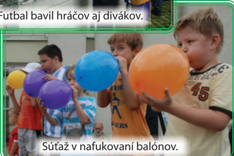
Súťaž v nafukovaní balónov.