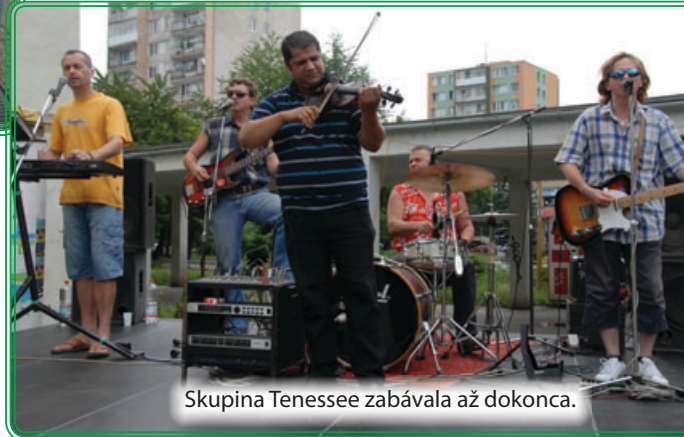
Skupina Tennessee zabávala až dokonca.