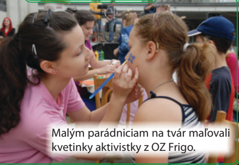
Malým parádniciam na tvár maľovali kvetinky aktivistky z OZ Frigo.