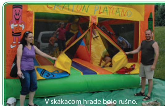
V skákacom hrade bolo rušno.