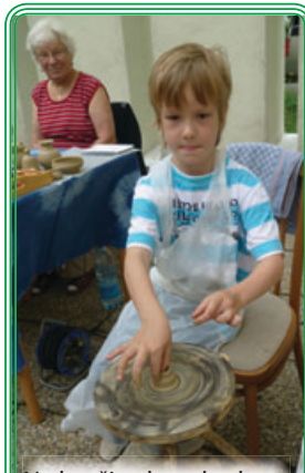
Na hrnčiarskom kruhu.

Ráno slniečko, neskôr mráčik, zasa slniečko a napokon poriadny lejak. Ani takéto počasie však neodradilo desiatky malých a veľkých obyvateľov sídliska, ktorí sa prišli v sobotu 18. júna 2011 zabaviť na oficiálne prvý