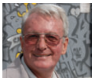
p. Ondrej ze stojí.“

Sú neprehraditeľné. Niektorým prekážajú, iným sa páčia. Aj na Tereze pribúdajú grafity. Niektoré účelne, iné v podobe poškodzovania majetku. O tie prvé sa postarali mladí umelci – sprejeri – ktorí budovy nepostriekali náhodne, ale doslova „na objednávku“ MČ Košice – Západ. Cieľom a podporou týchto aktivít je skrásliť fádne, zanedbané a ošarpané fasády niektorých budov. A aký je váš názor?