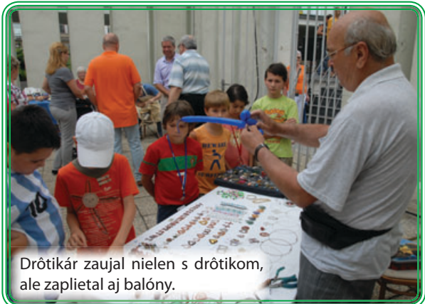
Drôtikár zaujal nielen s drôtikom, ale zaplietal aj balón.