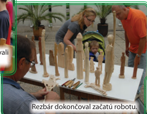
Rezbár dokončoval začatú robotu.