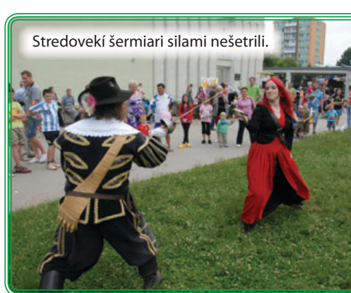
Stredovekí šermiari silami nešetřili.