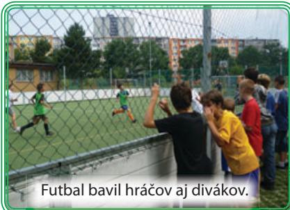
Futbal bavil hráčov aj divákov.

okružle 50. narodeniny najstaršieho a najkrajšieho sídliska v Košiciach.