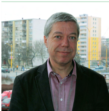
Vážení obyvatelia Terasy,

každý z nás má svoju rodinu. Každý má svoju matku, svojho otca, svojich starých rodičov, mnohí máme deti, každý má nejaký svoj „rodinný strom“. Rodina je a bude stále základnou jednotkou spoločnosti. Žiaľ, aj u nás na Terasy, tak ako v celej Európe, rodina ako inštitúcia stráca svoju hodnotu, niektoré deti prichádzajú o harmonické rodinné prostredie.