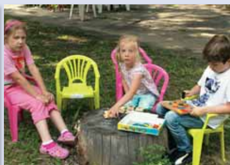
Rodinné popoludnie v materskom centre Delfínik prilákalo mnoho mladých rodín.