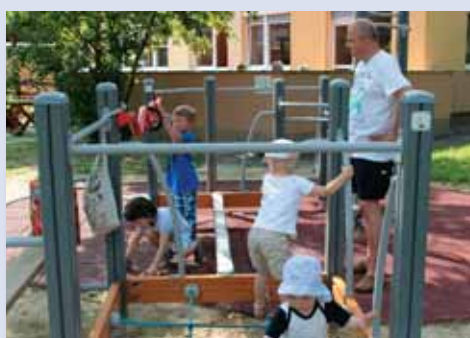
Deti si počas programu v materskom centre Delfínik zacvičili v Parku zdravia.