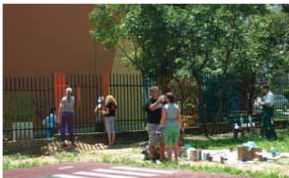
Dobrovoľníci z ČSOB a T-Systems Slovakia pomáhali v Materskej škole Hronská.

Do tohto najväčšieho dobrovoľníckeho projektu strednej Európy sa zapojili aj školy na Terasa. Boli to základné školy Bernolákova 16, Kežmarská 28 a Ma-