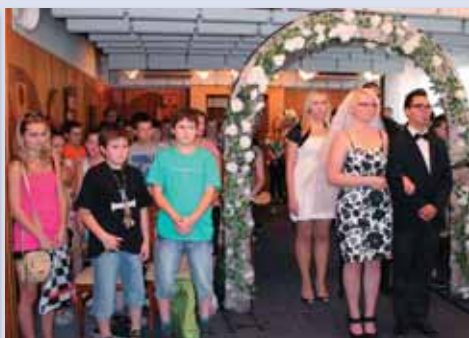
Žiaci z Terasy sa zúčastnili aj fingovaného civilného sobáša v priestoroch úradu.