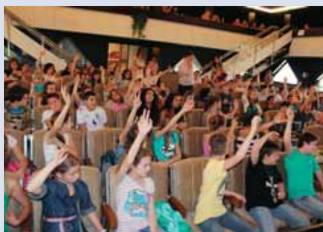
Študenti si počas „zasadnutia zastupiteľstva“ schválili dlhšie prázdniny.