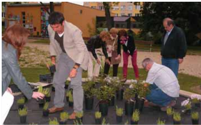
Obyvatelia žijúci pri výmenníku Brigádnicka a členovia neformálneho združenia Susedia pripravujú predzáhradku pred svojim blokom.

tomu, že staré detské ihriská, ako ich poznáme z minulých rokov, už nespĺňajú normy EÚ a sú nahrádzané oplotenými ihriskami s najmodernejším vybavením a bezpečnostnými certifikátmi.