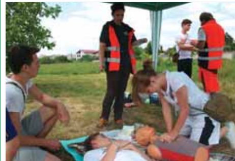
Mladí záchranári počas testu zo zdravotníckej prípravy.

Obvodný úrad Košice so sídlom na Komenského 52 v spolupráci s Centrom voľného času, Orgovánová 5 – e.p. DOMINO na Popradskej 86 v Košiciach, pripravili Krajské kolo mladých záchranárov civilnej ochrany.