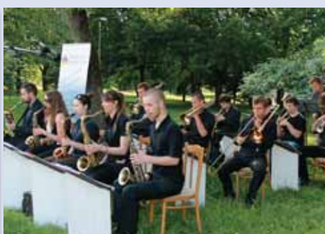
Deň Terasy uzavrel koncertu Big Bandu Košického konzervatória.