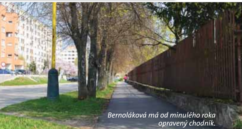
Bernoláková má od minulého roka opravený chodník.