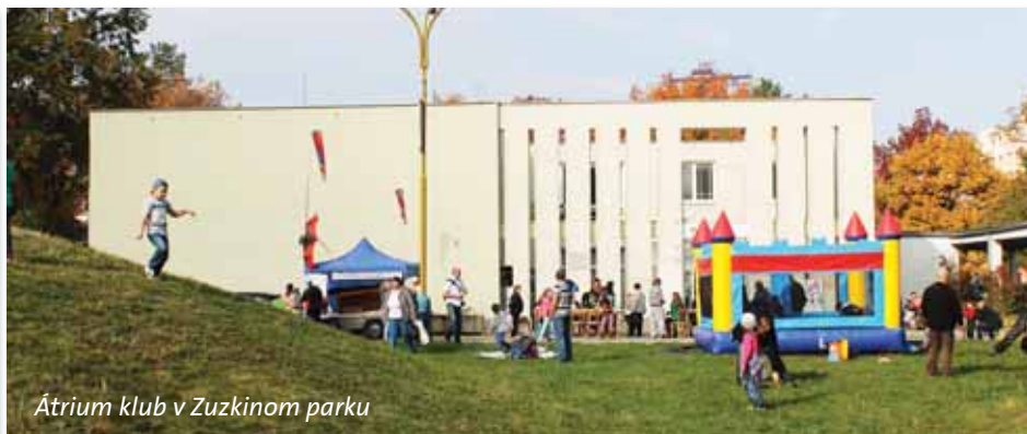
Átrium klub v Zuzkinom parku