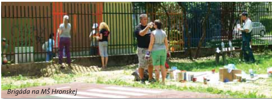
Brigáda na MŠ Hronskej

Dôchodcovia sa zas môžu tešiť na zaujímavé náučné i pohybové aktivity, ktoré im pripravujeme v spolupráci s mladými ľuďmi z našej mestskej časti.