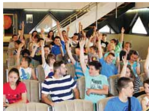
V obrátenej pyramíde sa študenti zahrli na poslancov. Hlasovali napríklad o tom, či by uprednostnili budovanie parkovísk alebo ihrísk.