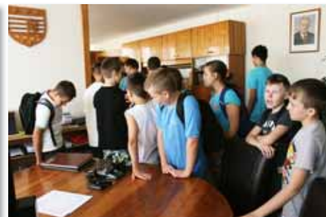
Zvedavci si mohli pozrieť starostovu kanceláriu. Ktovie, možno práve jeden z nich tu bude o niekoľko rokov pracovať.