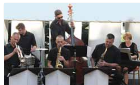
Hudobné zoskupenie Combo v Átrium klube.