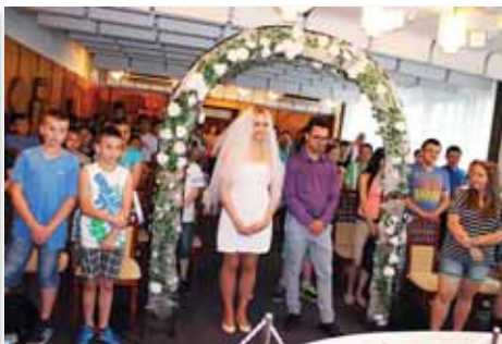
V budove miestneho úradu sa nachádza aj sobášna sieň. Študenti v nej zažili sobášny obrad.