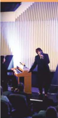
PRIMA MUSICA PYRAMIDA