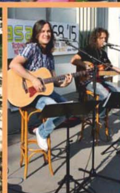
VIANOCE NA TERASE