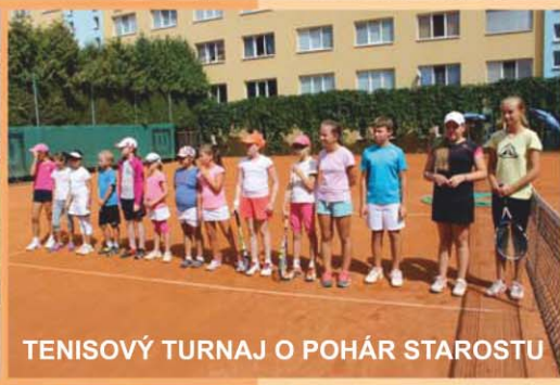
TENISOVÝ TURNAJ O POHÁR STAROSTU