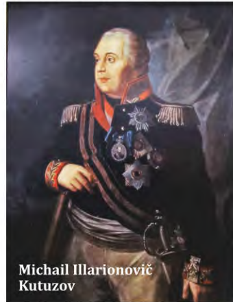
Michail Illarionovič Kutuzov

i poddaných, generáli v aristokratických palácoch. Na počesť Kutuzova usporiadali aj novoročný bál v Redute. Košičania si s Rusmi výborne rozumeli. Vojaci, ktorí