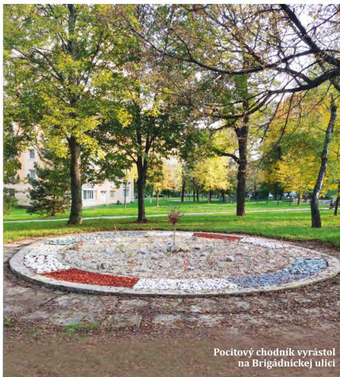
Pocitový chodník vyrástol na Brigádnickej ulici

Projektom do tohtoročného participatívneho rozpočtu bolo možné podávať do 22. 11. 2020. Teraz je už ten správny hlas vo vašich rukách. Všetky potrebné informácie,