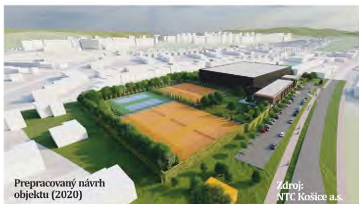
Prepracovaný návrh objektu (2020)

mom parkovacích miest pred OC Optima v čase konania športových či kultúrnych akcií. Podľa navrhovateľného riešenia mala medzi Optimou a Popradskou premávať v čase konania podujatí kyvadlová doprava. Našťastie tento nezmysel ostal len na papieri. Na základe prijatého uznesenia Mestského zastupiteľstva v Košiciach bola v roku 2019 vypracovaná nová hluková štúdia, ktorá vyvrátila nesprávne závery skoršej štúdie o tom, že „navrhovaná činnosť nezhorší hlukové pomery v posudzovanej obytnej zóne a nespôsobí zhoršenie životných podmienok