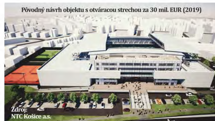
Pôvodný návrh objektu s otváracou strechou za 30 mil. EUR (2019)

šice-Západ schválilo vyjadrenie k zmenenému projektu NTC na Popradskej ulici s vecnými pripomienkami obyvateľov. Následne poslanci mestského zastupiteľstva schválili nové Memorandum o spolupráci so Slovenským tenisovým zväzom pri výstavbe tenisového centra. To, že sme upozornili na existenciu územnoplánovacích regulatívov pre dané územie, ušetrilo daňovníkom Slovenskej republiky približne 15 miliónov eur. Teraz nastala