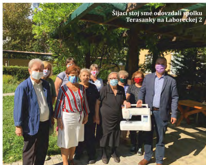
Šijací stroj sme odovzdali spolku Terasanky na Laboreckej 2