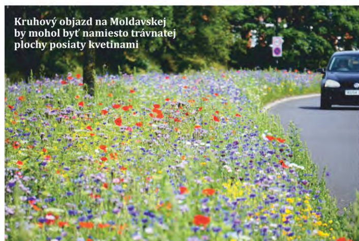
Kruhový objazd na Moldavskej by mohol byť namiesto trávnej plochy posiaty kvetinami