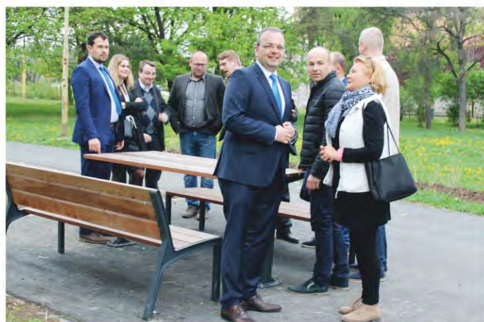
Mgr. Marcel Vrchota starosta Mestskej časti Košice-Západ